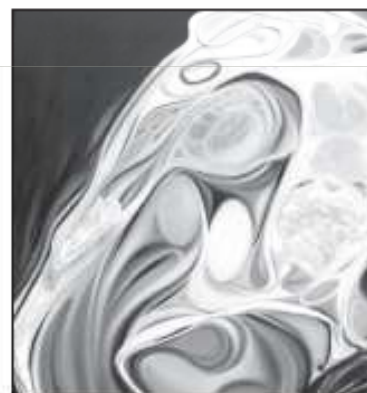
Hommes et femmes sont créateurs dans l'œuvre picturale de Brigitte Martinez.