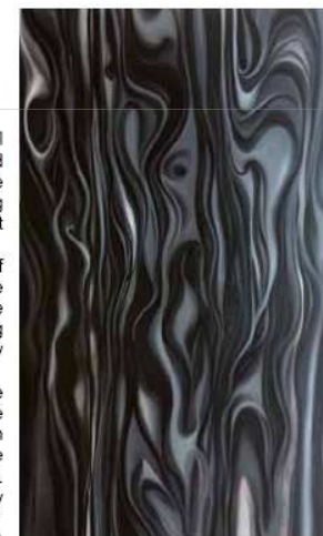
Rebirth Oil on Wood 81" x 53"