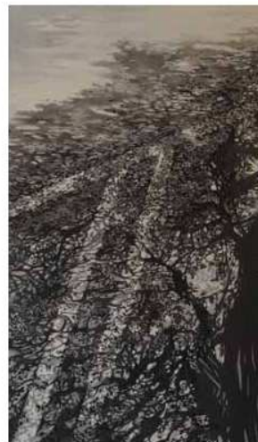
City Arbol Oil on Wood 81" x 53"